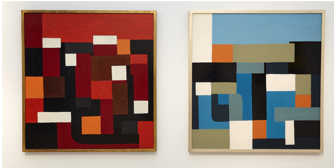
Tímabil strangflatalistar var merkilegt millibilsástand í íslenskrumyndlist á 20. öld sem fjallað er um í sýningunni Geómetríu í Gerðarsafni og í bókinni Abstrakt – Geómetría á Íslandi 1950–1960.

Það er með ólíkindum hvað það hefur reynst listfræðingum landsins erfitt að brjóta til mergjar þessa íslensku útgáfu strangflatalistar, umfang hennar og eðli. Það reyndi Ólafur Kvaran einna fyrst með sýningu sinni og sýningarbæklingi um Septemberhópin 1990. Strangflatalistin var aftur til umfjöllunar á sýningunni Draumurinn um hreint form á Listasafni Íslands árið 1998 og í Íslenskrumyndlist