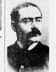
Rudyard Kipling — Inflationen plagede ham i Lahore (dengang Indien, nu Pakistan).