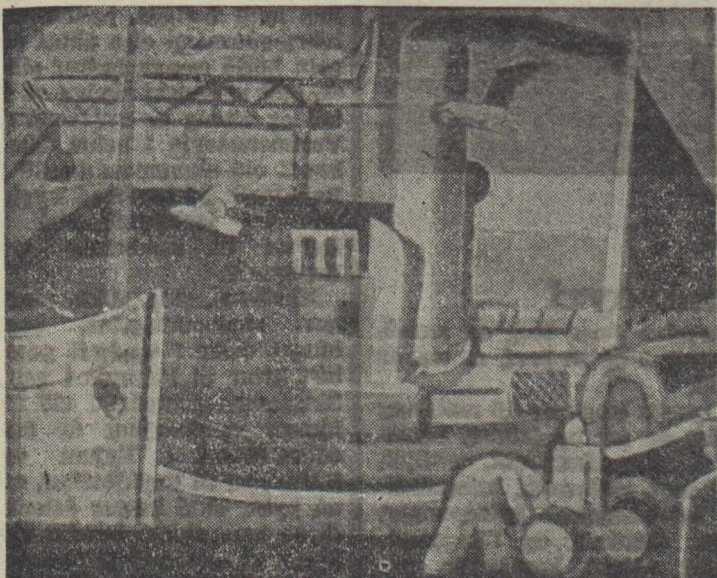
„Frá höfninni“ eftir Þorvald Skúlason, sem mun öðrum sjálf sagðari þátttakandi í þessari sýningu, bæði sem einn fremsti listamaður þjóðarinnar — og Húnavetningur.