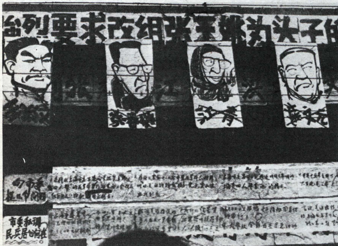
Myndir af fjórmeningunum sem handteknir voru og sakaðir um byltingarundirbúning hanga um allt í Shanghai ásamt veggspjöldum, þar sem þeir eru fordæmdir.

stuðningsmönnum sínum í járnbrautarkerfinu og borgarsveitunum í Shanghai. Þeir bættu öllum tiltækum ráðum og gerðu allt sem í þeirra valdi stóð til að hrfisa völdin.